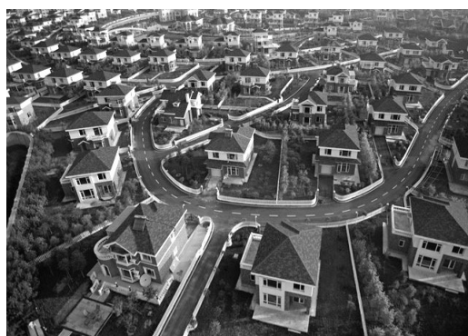
C. külső lakóöv