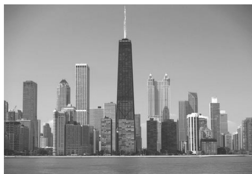
B. belső munkahelyöv / city