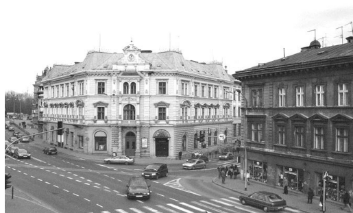
A. belső lakó(hely)öv