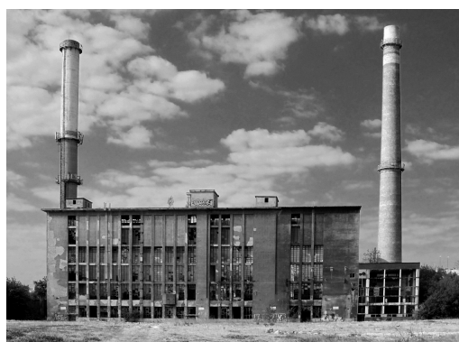
D. külső munkahelyöv